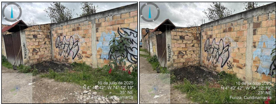
Ilustración 5 – Punto Recuperado

Finalmente, se recolectaron un aproximado de 350 Kg (kilogramos) de RCD y se reporta el punto como recuperado. (Ver ilustración 5)