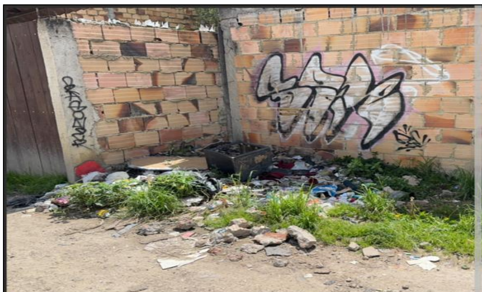
Ilustración 2. Evidencia Punto Crítico

Durante la jornada, el personal de la Secretaría de Ambiente y Bienestar Animal de Funza llevó a cabo la separación de los residuos ordinarios (ver ilustración 3) con el fin de garantizar que los RCD dispuestos en este punto crítico quedaran lo más limpios posible. Esta acción responde a un requisito establecido por la empresa INGENIEROS GF S.A.S. (gestor inscrito ante la jurisdicción CAR) para asegurar un aprovechamiento adecuado de los RCD (ver ilustración 3).