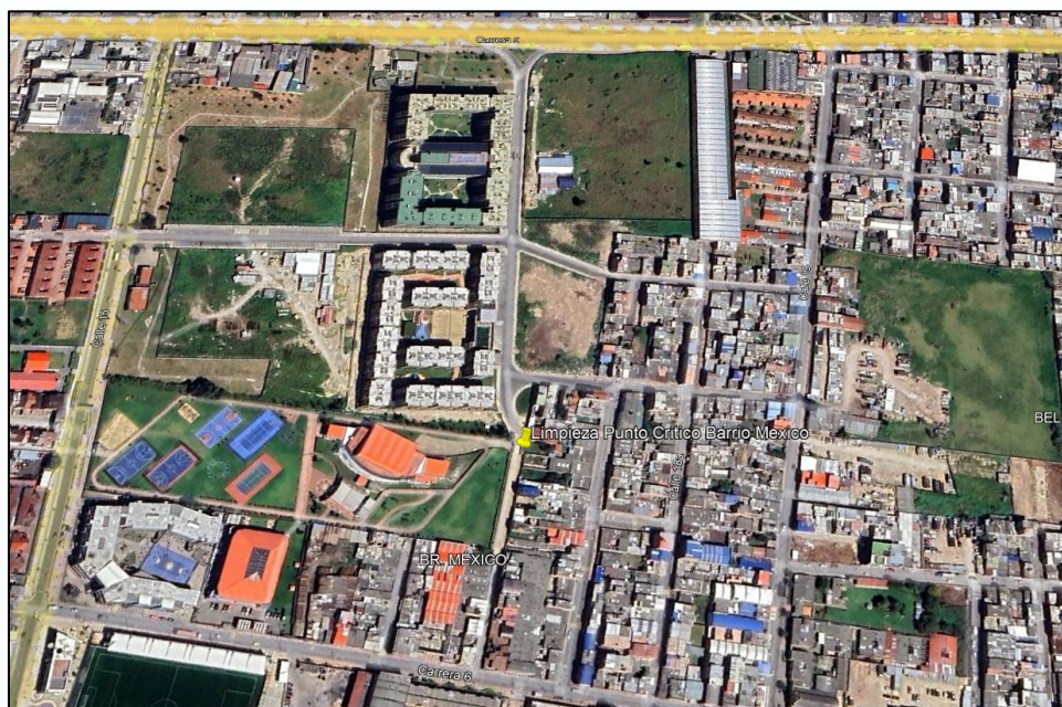
Ilustración 1. Punto de limpieza

Con la finalidad de recuperar la limpieza el orden y evitar vectores relacionados con la acumulación de residuos y dar cumplimiento a lo establecido en el Artículo 46 del Decreto 2981 de 2013 el cual menciona ... "Censo de puntos críticos. Las personas prestadoras del servicio público de aseo en las actividades de recolección y transporte en su área de prestación harán censos de puntos críticos, realizarán operativos de limpieza y remitirán la información a la entidad territorial y la autoridad de policía para efectos de lo previsto en la normatividad vigente. El municipio o distrito deberá coordinar con las personas prestadoras del servicio público de aseo o con terceros la ejecución de estas actividades y pactar libremente la remuneración." ..., el día 15 de julio de 2025 se realizó la limpieza en el punto crítico ubicado en el barrio México (Ver ilustración 1 y 2).