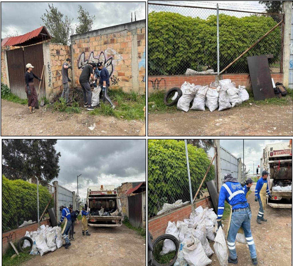
Ilustración 4. Recolección EMAAF

Una vez finalizado lo anterior, se realizó la disposición de RCD en lonas con la finalidad de facilitar la recolección la cual fue realizada por la Empresa de Acueducto, Alcantarillado y Aseo de Funza – EMAAF SAS ESP (ver ilustración 4).